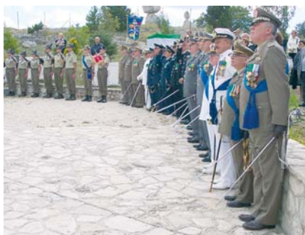
Celebrazione della 9ª Giornata Nazionale Mauriziana

A Pescocostanzo d'Abruzzo è stata celebrata la 9ª giornata nazionale Mauriziana, presso il Sacrario Nazionale Mauriziano d'Italia, alla presenza di oltre duemila persone e delle rappresentanze militari dei Decorati di Medaglia d'Oro Mauriziana dell'Esercito, della Marina, dell'Aeronautica, dei Carabinieri, della Guardia di Finanza e di un Reparto in armi del 9° Reggimento Alpini, unitamente alle Associazioni Combattentistiche e d'Arma. La Santa Messa è stata officiata dal Cappellano Militare Don