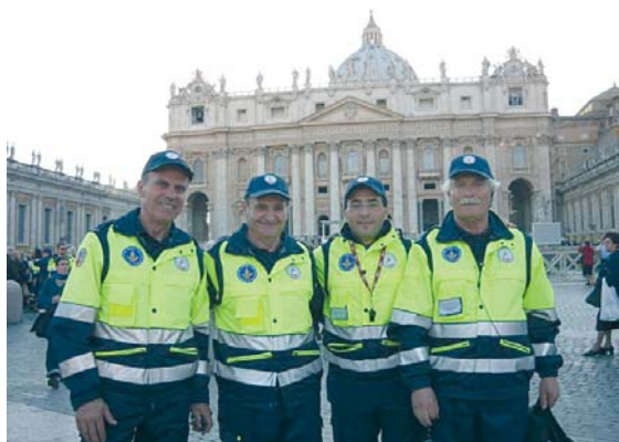
Alcuni degli Autieri del Gruppo di P.C. della Sezione di Roma, presenti alla veglia di preghiera a San Pietro

Un nucleo del Gruppo di Protezione Civile della Sezione ANAI di Roma ha partecipato, il 2 aprile scorso, alla veglia di preghiera che si è tenuta in San Pietro, per l'assistenza alle migliaia di pellegrini convenuti per l'importante occasione.