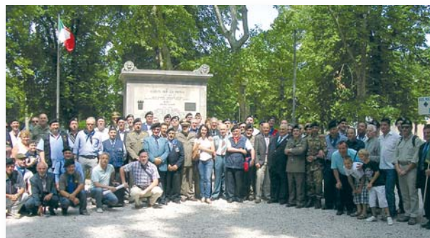
Foto di gruppo per gli Autieri partecipanti al 1° Raduno nazionale del disciolto Btg.L. "Gorizia"

Grazie al tam tam iniziato sul web sul finire dello scorso anno (sul sito www.najagradisca.com e sul social network Facebook), un centinaio di Autieri si sono ritrovati il 18 giugno scorso a Gradisca d'Isonzo (GO) per il primo Raduno nazionale del disciolto Battaglione Logistico "Gorizia" che dal 1975 al 1997 ebbe la sua sede nella Caserma "Ugo Polonio". La manifestazione, patrocinata dal Comune di Gradisca d'Isonzo e dalla Delegazione Regionale ANAI del Friuli V. G., ha visto una folta presenza di Ufficiali (tra cui 5 ex Comandanti del Battaglione) e Sottufficiali in servizio ed in congedo, oltre a numerosi militari di leva.