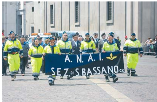
Il Gruppo di P.C. ANAI di San Bassano partecipa al Raduno di Assoarma a Torino

13 luglio - Sede operativa di Pizzighettone: prova formativa per Volontari di Protezione Civile. Gestione Campo tendato, strutture di comando e servizi.