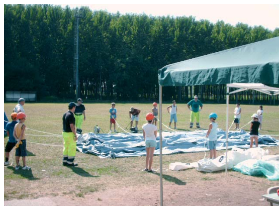
Montaggio della tenda pneumatica

27 giugno - sede di Gera: giornata "Giovani & Volontari" rivolta ai bambini della scuola primaria, classi