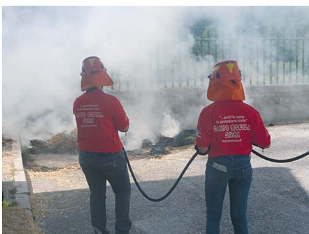
In alto: la "squadra di primo soccorso" simula l'intervento sanitario; sopra: la "squadra antincendio" all'opera

provveduto al trasporto dell'infortunato all'ospedale più vicino.