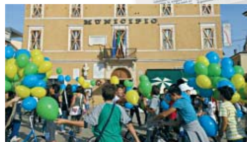
I bambini di Bondeno lanciano i palloncini in piazza durante la festa del volontariato

Una festa apertasi al mattino, con l'arrivo di un centinaio di Autieri davanti al monumento di via Vittorio Veneto. Per una cerimonia (la 38esima) svoltasi come un anno fa all'aperto, questa volta per la contingenza del terremoto, che ha reso inagibili quasi