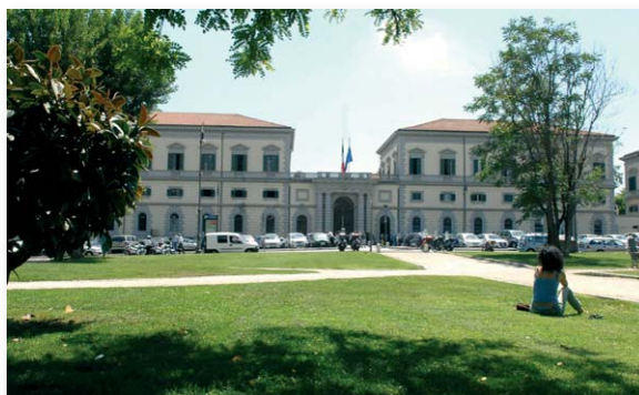
Il Policlinico Militare "Celio" di Roma

Il Comune di Roma ha riconosciuto la cittadinanza onoraria al Policlinico militare di Roma "Celio", per "la costante attività svolta a salvaguardia della salute dei cittadini. Infatti, nel corso degli anni l'ospedale ha contribuito al supporto della sanità cittadina, assorbendo in maniera eccellente le emergenze ospedaliere della città. Il lavoro di specialisti di primo ordine e il continuo investimento in apparecchiature moderne sono da sempre motivo di vanto per il Policlinico militare che si è meritato un posto d'onore nella sanità romana anche grazie all'efficace ricerca avviata per la ricostruzione delle ossa utilizzando innesti di cellule staminali e piastrine.