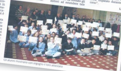
Gli alunni mostrano con orgoglio il loro attestato

Il sindaco si è raccomandato "la massima prudenza quando si è per strada e sotto delle regole attenti nel la altri possa essere in pericolo". Molto soddisfatta la Cassetta che ha invitato gli autieri ad estendere tale progetto pilota a tutti i plessi del comprensivo. Al momento del corso Maccario ha lanciato un ultimo appello ai bambini: "Tieni e agli amici quello che avete imparato durante il corso".