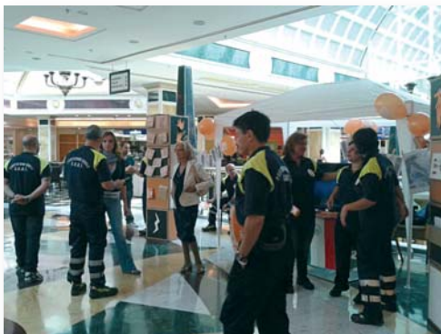
Volontari della Sezione di Roma impegnati nella campagna "Terremoto io non rischio"

L'iniziativa è promossa dal Dipartimento della Protezione Civile e dall'Anpas - Associazione Nazionale delle Pubbliche Assistenze, in collaborazione con l'Ingv - Istituto Nazionale di Geofisica