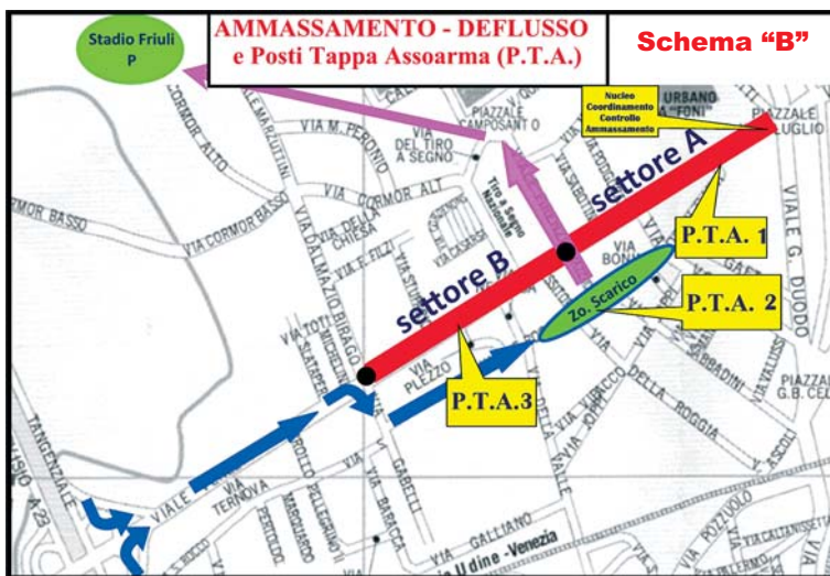
Il settore B è zona di ammassamento per le rappresentanze ANAI

Le Associazioni e le Rappresentanze Estere raggiungeranno