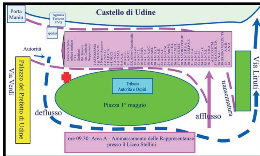
23 Maggio 2015. Commemorazione militare in Piazza 1° Maggio, ore 10.30

Ore 11.00: Ammassamento per lo sfilamento. Esibizione della Fanfara