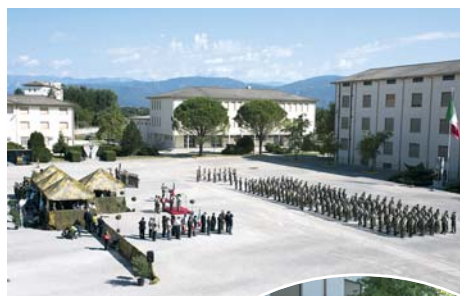
Da sin.: Il Reparto schierato sul piazzale d'Onore; il passaggio di consegne della bandiera di guerra dal Comandante cedente al subentrante; alcune moto d'epoca