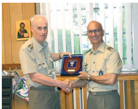
Visita del Gen. C.A. Adriano Vieceli al Polo Nazionale di Piacenza: il Direttore del Polo Col. Barbera dona il Crest al C.te Logistico dell'Esercito; il briefing di presentazione dell'Ente

(uffici, sale ricezione, collaudo e spedizioni, magazzini manuali ed automatizzati, magazzini pneumatici e batterie), prendendo visione delle attività operative svolte in sostegno dei teatri operativi e dei