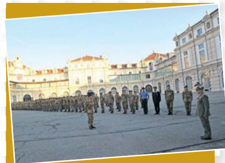
Il 196° Corso d'Accademia, con i nuovi Ufficiali TRAMAT è giunto alla Scuola di Applicazione di Torino.

Al termine della cerimonia hanno sfilato alcuni mezzi moderni e diversi mezzi storici resi disponibili dalla Sezione ANAI dell'Emilia Romagna, dall'Associazione CRCS e dall'Associazione Nazionale Bersaglieri.