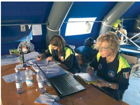
I Volontari della colonna mobile dell'ANAI impegnati nel soccorso alle popolazioni terremotate del Centro Italia

gnana e di Chianciano sono preallertati per intervenire su chiamata per la gestione dei campi.