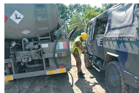
Attività di sostegno logistico dell'8° Reggimento Trasporti "Casilina" nel Comune reatino di Cittareale a seguito del sisma in Centro Italia

È stato inoltre impiegato un team di personale costituito da 1 SU. responsabile del Deposito, due conduttori con abilitazione al trasporto merci pericolose e quattro graduati addetti alla distribuzione e contabilità, oltre a due elementi posizionati presso il punto di distribuzione di benzina presso Cittareale.