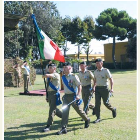
Gruppo Bandiera durante una cerimonia