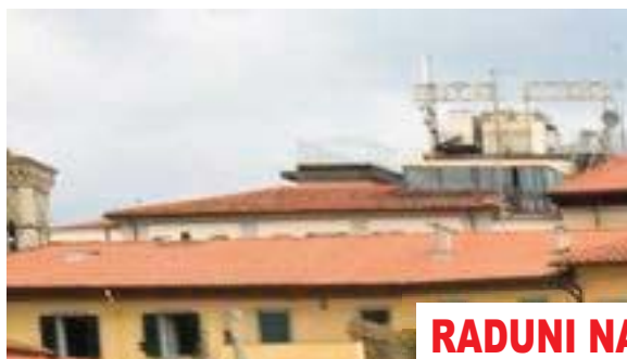
RADUNI NAZIONALI E REGIONALI

L'ANAI CUSTODISCE E SOSTIENE LE TRADIZIONI DEL CORPO AUTOMOBILISTICO, OGGI ARMA DEI TRASPORTI E MATERIALI, CHE RINNOVA CON L'ORGANIZZAZIONE DI MANIFESTAZIONI PATRIOTTICHE NAZIONALI E REGIONALI, CON LE ATTIVITÀ DI PROTEZIONE CIVILE , DI EDUCAZIONE ALLA SICUREZZA STRADALE NELLE SCUOLE E CON LA SCUDERIA AUTIERI D'ITALIA . ISCRIVENDOTI ALL'ASSOCIAZIONE RICEVERAI INOLTRE LA RIVISTA TRIMESTRALE "L'AUTIERE" ED IL NOTIZIARIO MENSILE ON-LINE.