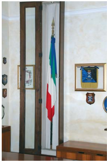
La Bandiera dell'11° Rgt.Tra. "Flaminia" custodita nell'ufficio del Comandante

Di seguito la motivazione del conferimento.