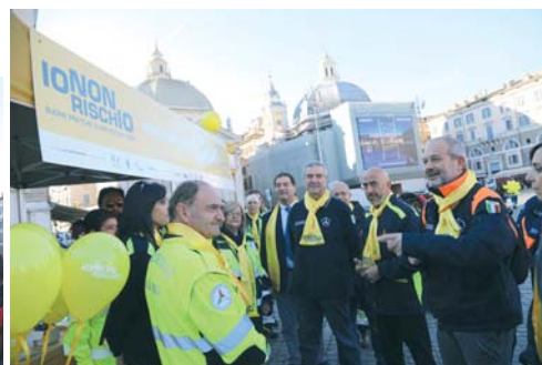
I Volontari di PC della Sezione di Roma in Piazza del Popolo, insieme alle altre Associazioni partecipanti