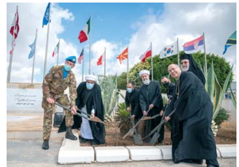
L'arrivo dei partecipanti all'incontro; insieme per la pace; un momento di preghiera davanti alla statua della Madonna; l'ulivo, simbolo della pace, piantato dai rappresentanti delle varie religioni

essere umano in questi momenti così difficili. In un clima sereno e cordiale, basandosi sugli elementi comuni che costituiscono i pilastri della pace e dell'armonia tra le varie comunità, tutti hanno convenuto sull'importanza del dialogo e della convivenza pacifica tra i diversi culti. Le autorità religiose presenti all'incontro hanno rivolto apprez-