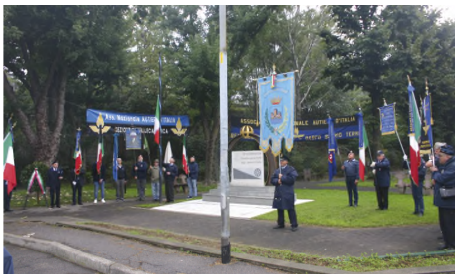
Celebrazione della 41 a Ottobrata dell'Autiere, del 50° anniversario di costituzione della Sezione della Valle Camonica e 13° anniversario dell'inaugurazione del Monumento agli Autieri Caduti

scono a mantenere vivo il ricordo e le tradizioni dell'Arma Trasporti e Materiali.