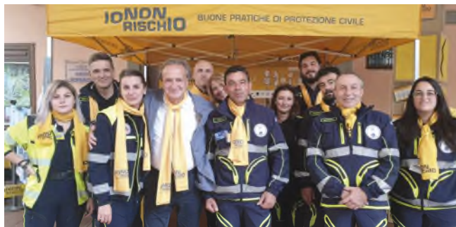
I Volontari di PC della Sezione ANAI Garfagnana insieme al Sindaco di Castelnuovo