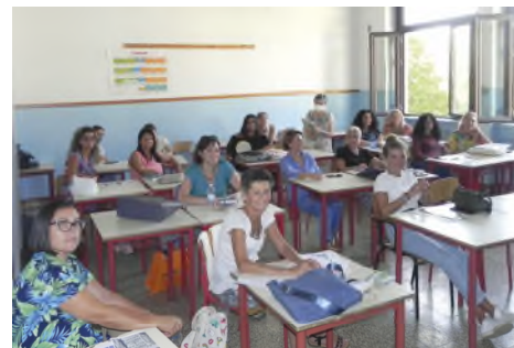
Corso di Formazione a favore dei Docenti della Scuola dell'Infanzia "Cino del Duca" di Bresso e dell'Istituto Comprensivo "Luigi Cadorna" di Milano