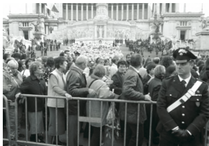
La popolazione rende onore ai Caduti di Nassiriya e deposita mazzi di fiori al Vittoriano (2003)

Gli Autieri d'Italia formulano un affettuoso saluto alle famiglie dei Caduti, il cui ricordo rimarrà sempre nei loro cuori.