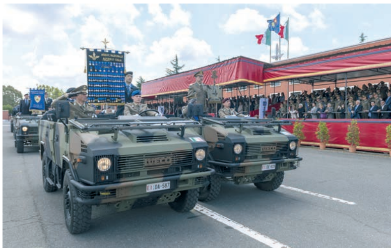
Le attività sociali