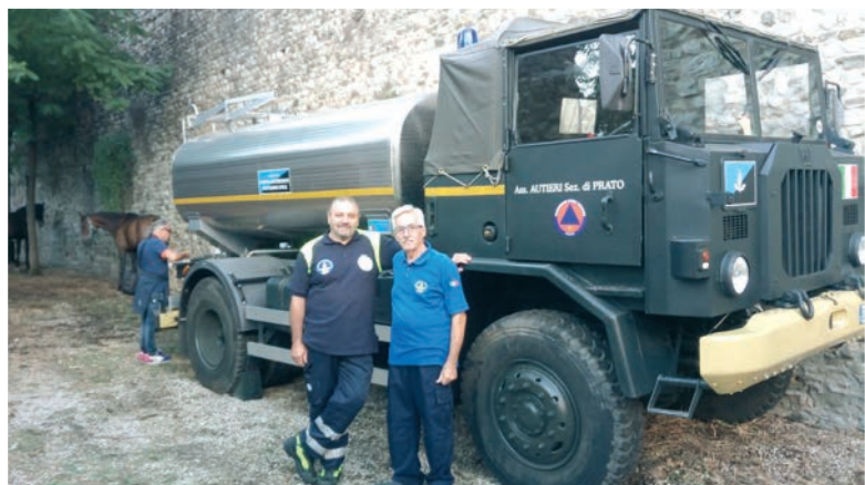
La Protezione Civile