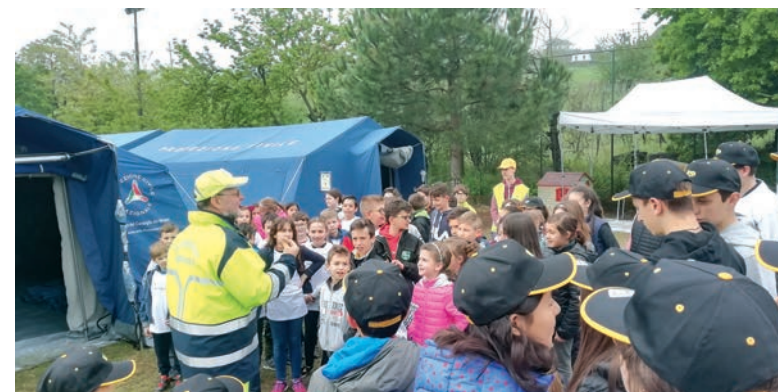
La Campagna "Io non rischio"