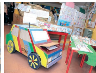
Scuderia Autieri d'Italia